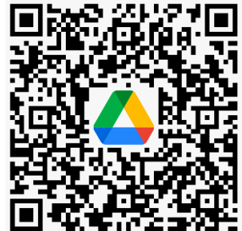
社規師資訊雲端平台